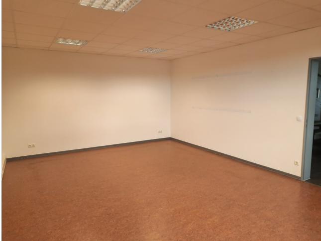
Schulungs-/Besprechungsraum Bild 2