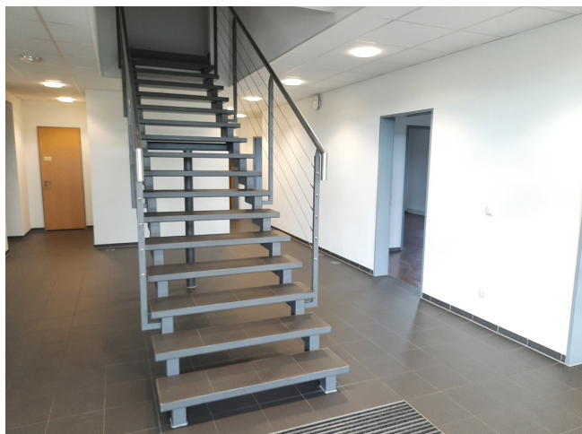
Eingangsbereich Bild 3