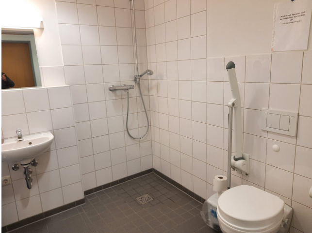
rollstuhlgerechtes WC mit Dusche