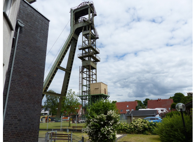
Außenansicht Blick Förderturm