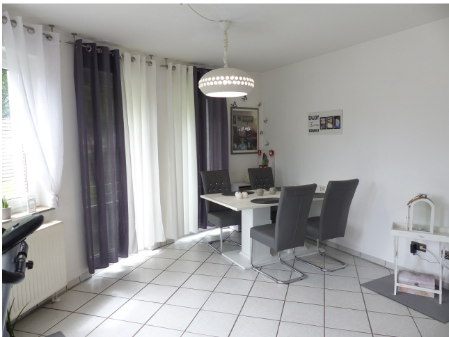
Wohn-/Esszimmer Bild 2