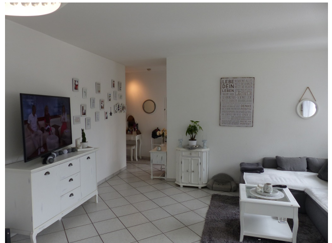
Wohn-/Esszimmer Bild 3