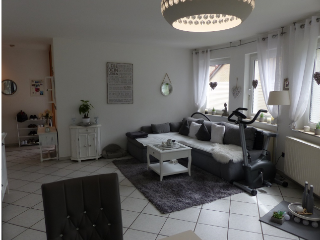
Wohn-/Esszimmer Bild 4