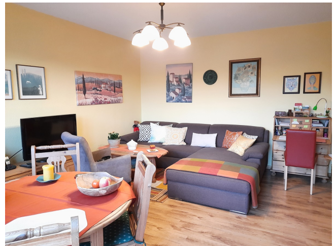
Wohnzimmer Bild 3