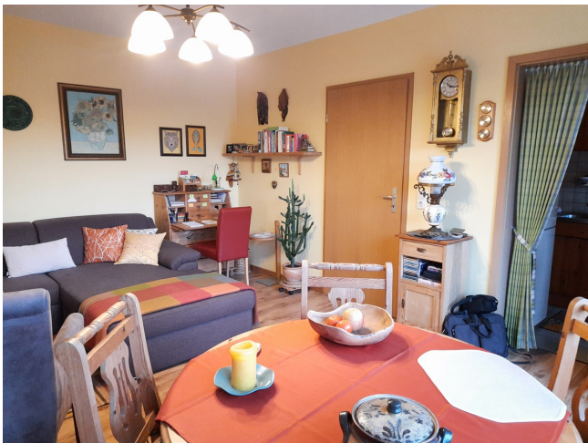
Wohnzimmer Bild 2