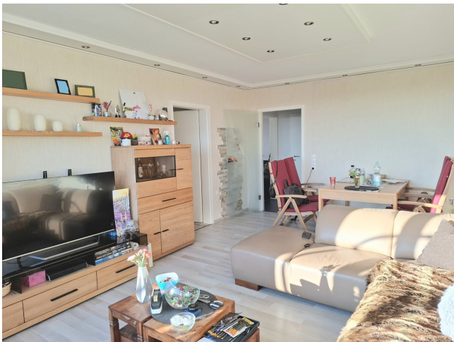
Wohn- / Esszimmer Bild 2