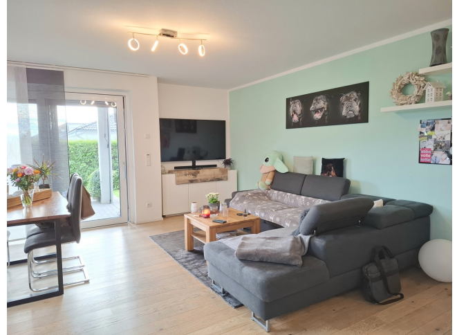
Wohnzimmer Bild 2