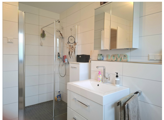
Badezimmer Bild 2

Vorbehaltlich weisen wir darauf hin, dass die Objektangaben auf Informationen des Eigentümers beruhen und von uns nicht weiter überprüft worden sind, deshalb übernehmen wir keine Gewähr für deren Richtigkeit.