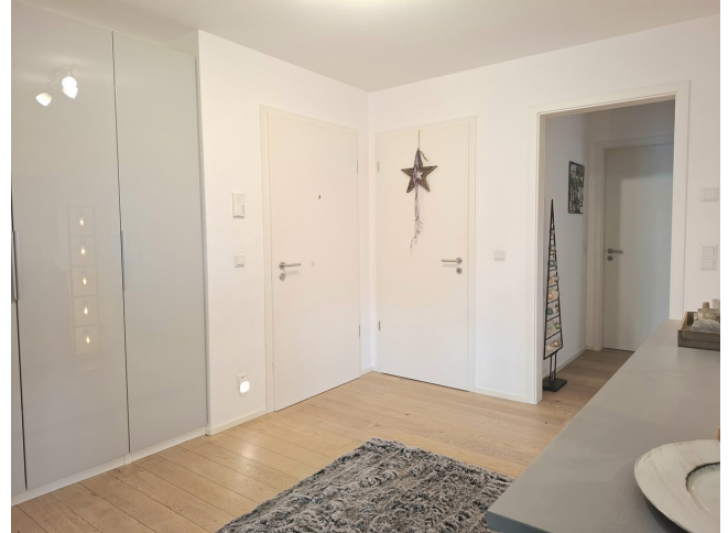
Diele / Eingangsbereich

Vorbehaltlich weisen wir darauf hin, dass die Objektangaben auf Informationen des Eigentümers beruhen und von uns nicht weiter überprüft worden sind, deshalb übernehmen wir keine Gewähr für deren Richtigkeit.