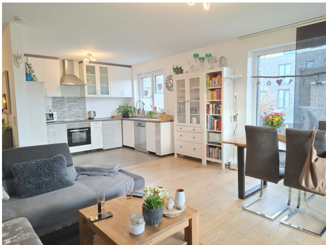
Wohnzimmer mit offener Küche