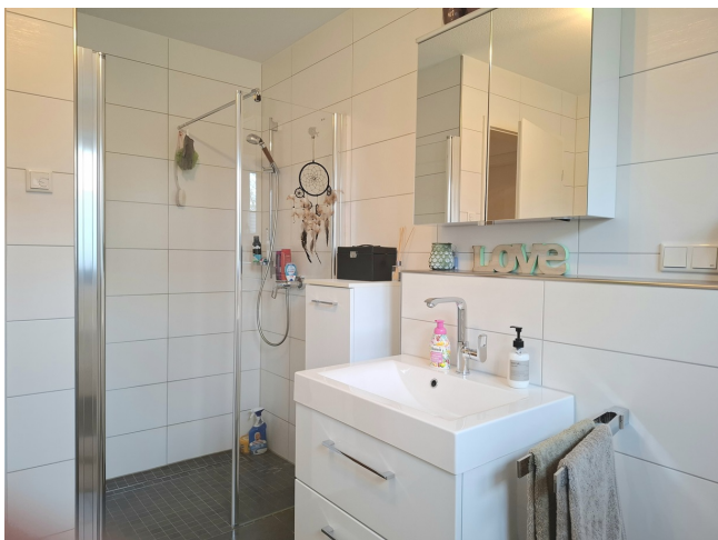
Badezimmer Bild 2