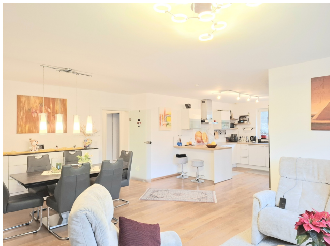
Wohnzimmer Bild 2