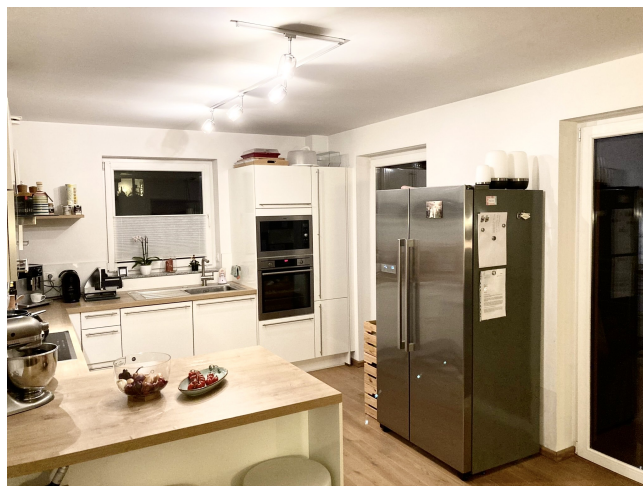
Küche Bild 2

Vorbehaltlich weisen wir darauf hin, dass die Objektangaben auf Informationen des Eigentümers beruhen und von uns nicht weiter überprüft worden sind, deshalb übernehmen wir keine Gewähr für deren Richtigkeit.