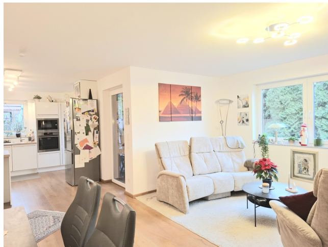
Wohnzimmer Bild 3