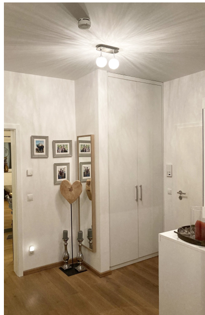
Diele / Eingangsbereich

Vorbehaltlich weisen wir darauf hin, dass die Objektangaben auf Informationen des Eigentümers beruhen und von uns nicht weiter überprüft worden sind, deshalb übernehmen wir keine Gewähr für deren Richtigkeit.