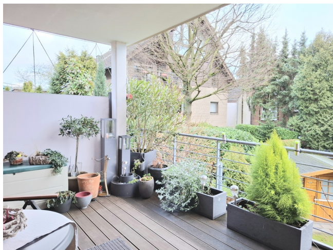
Südbalkon Bild 2