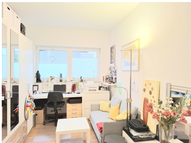
Kinder- / Arbeitszimmer