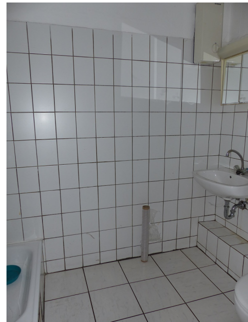
WC mit Dusche