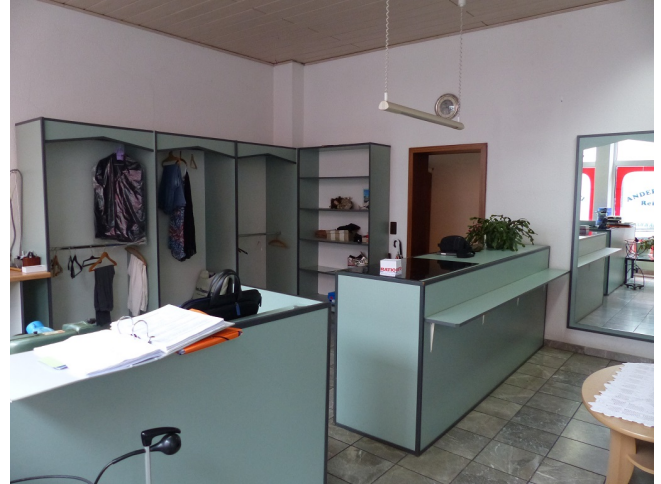
Verkaufsfläche Bild 3