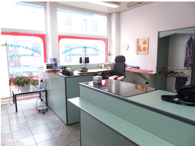
Verkaufsfläche Bild 2