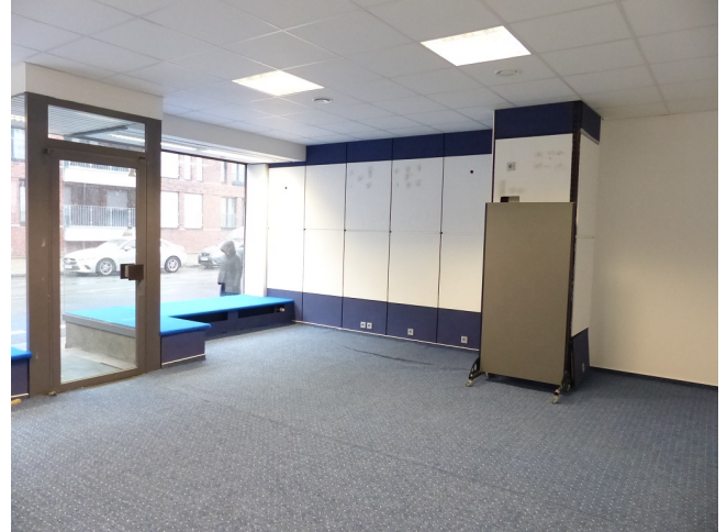
Ladenfläche Bild 2