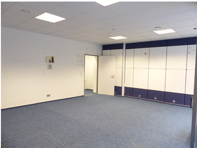
Ladenfläche Bild 3