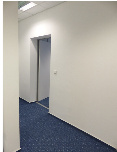
Diele Bild 2