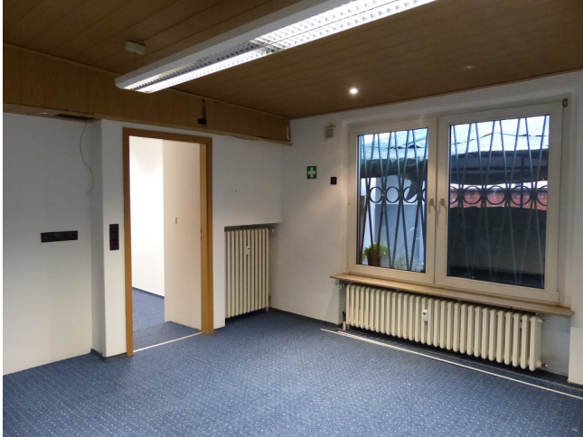
Büroraum Bild 1