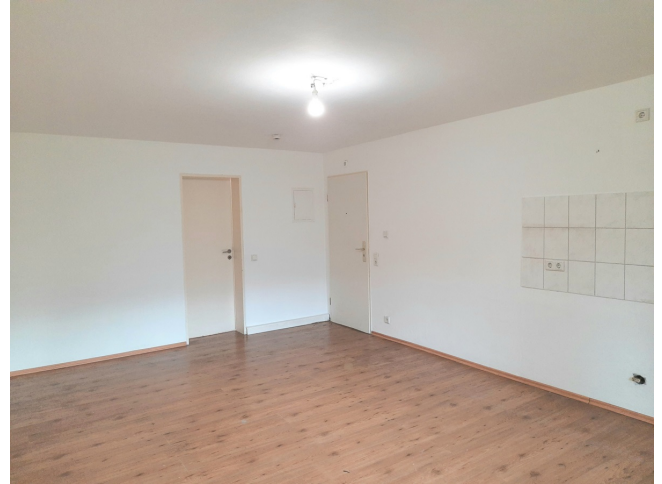
Appartement Bild 2