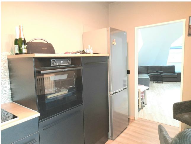
Küche Bild 2