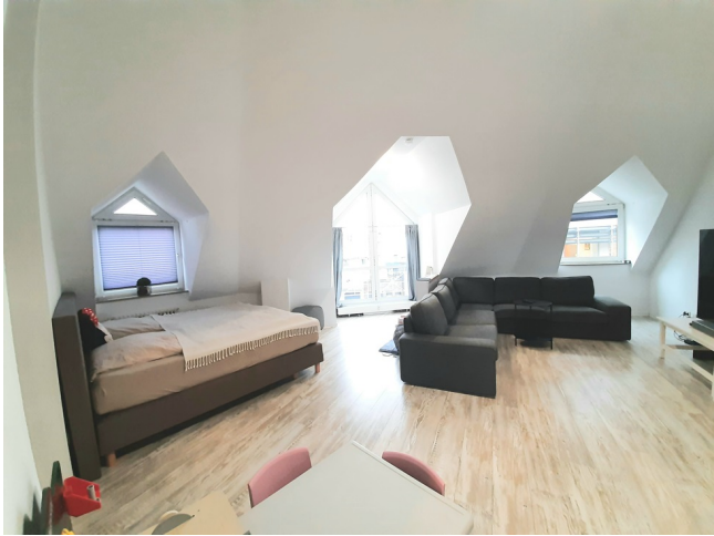
Wohn- / Esszimmer