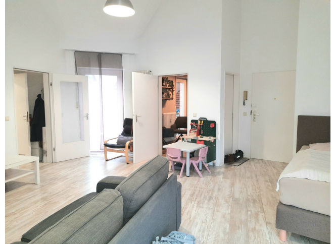
Wohn- / Esszimmer Bild 2