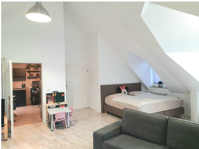
Wohn- / Esszimmer Bild 3