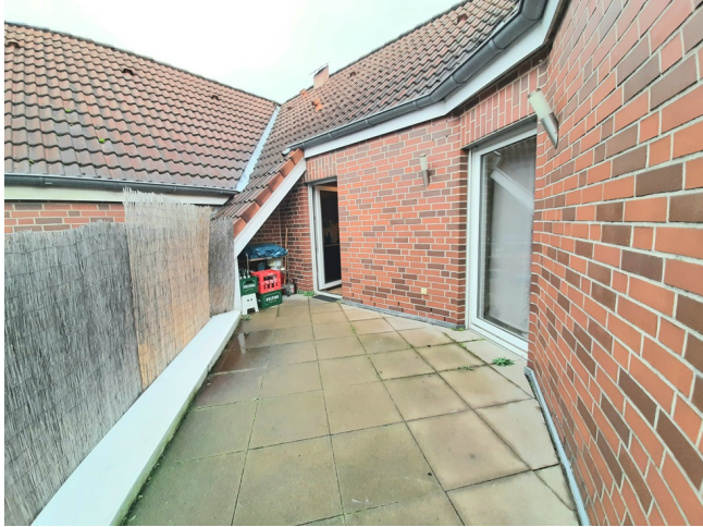
West-Loggia Bild 2