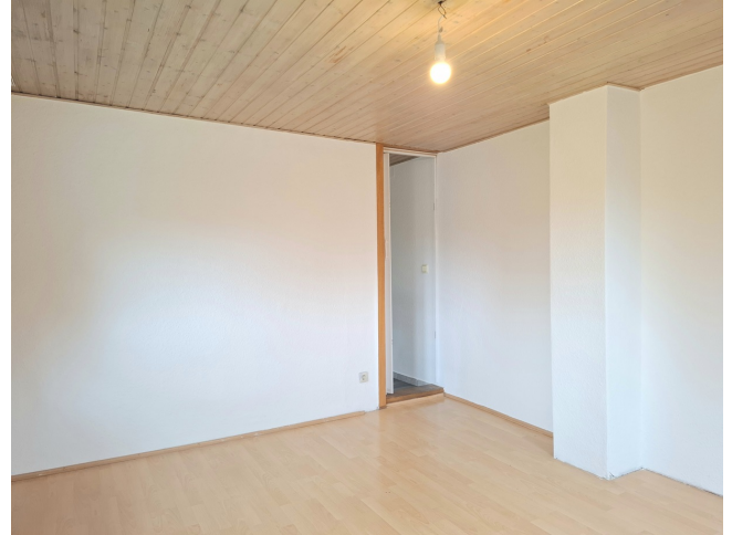
Wohnzimmer Bild 2