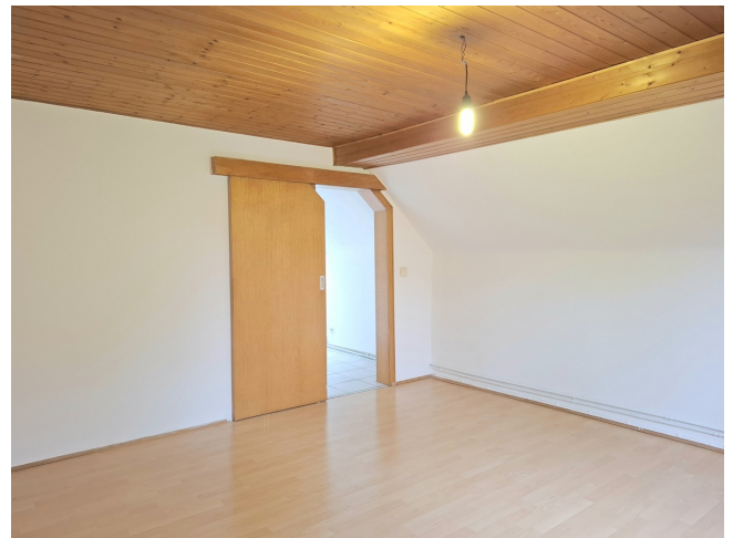
Schlafzimmer Bild 2